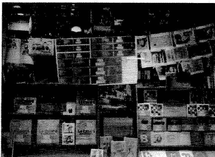
PARIS. L'observatoire associatif du livre et de l'écrit met en place une grande opération d'affichage pour défendre les librairies de proximité et la loi de 1981 sur le prix unique du livre.